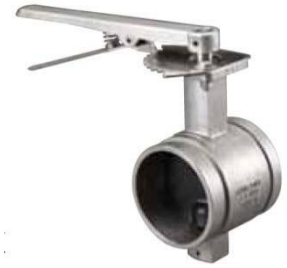
SJ-400-L 2" – 8"

秀而久型號 SJ-400L 溝槽式不鏽鋼蝴蝶閥本體由不鏽鋼 CF8M (316) 鑄造而成，其安裝台規格符合 ISO 5211，配備具安全鎖的十段式操作手把。end-to-end 尺寸符合 MSS SP-67。工作壓力為 300 psi (20 bar)。閥體的頸部設計可供 2" (50 mm) 以下隔熱墊片包覆所需空間。閥瓣具特殊 M 形瓣緣設計，其包膠材質可選擇等級 E-pw (EPDM) 可使用在給水系統，或是等級 T (Nitrile) 可使用在含油的管路。包膠材質等級 E-pw (EPDM) 經 UL 認證符合 NSF/ANSI 61 及 NSF/ANSI 372 飲用水規範。